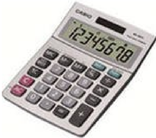
Рисунок 1. Пример непрограммируемого калькулятора

- калькуляторы должны иметь гарантии завода изготовителя и систему технической поддержки.