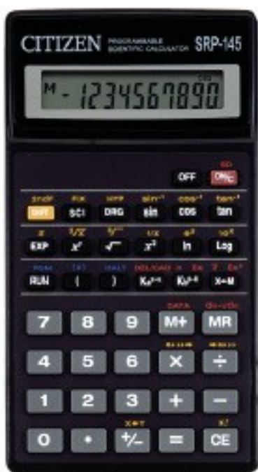
Рисунок 2. Пример программируемого калькулятора